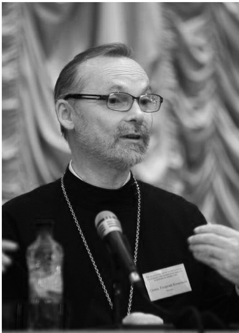
Неистовый реформатор священник Георгий Кочетков