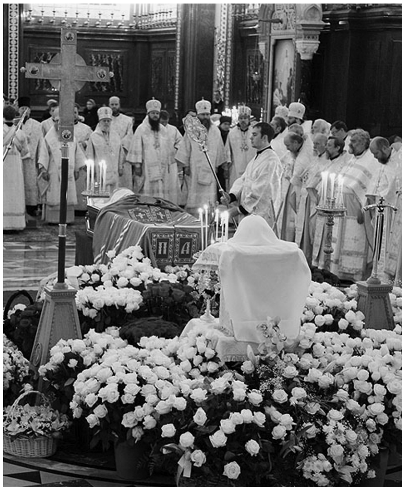
Во время отпевания блаженно почившего Святейшего Патриарха Алексия II