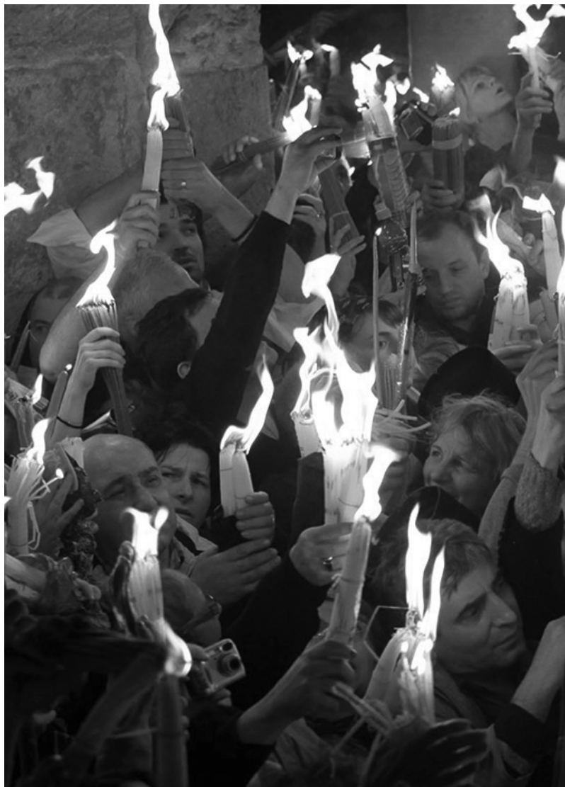
Схождение Благодатного Огня у Гроба Господня